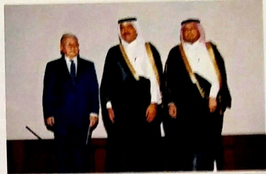
مستشار الشؤون العامة في رميحي في السفير الأذربيجاني

أكد سعادة الدكتور توفيق عبدالله ييف سفير جمهورية أذربيجان لدى قطر مائة العلاقات القطرية-الأذربيجانية، قائلاً: «إنها علاقات أخوية يعززها التعاون المثمر في مختلف المجالات، حيث تجمع البلدين مصالح متبادلة وتعاون متطرد في المجالات السياسية والاقتصادية والثقافية، كما يجمعهما تعاون ناجم طويل المدى في إطار المنظمات الدولية مثل الأمم المتحدة ومنظمة التعاون الإسلامي».